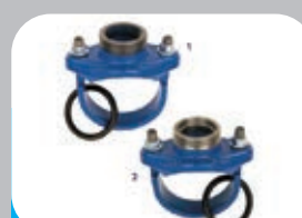
RACCORDO X TUBO GHISA X DUO BAG DN 3"