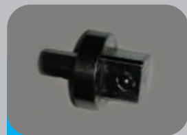
PORTA TAPPI QUADRO 1/2" X DUO BAG 12

DUO BAG 12 è una attrezzatura di semplice utilizzo e permette di lavorare in modo rapido ed efficace su tubazioni gas da DN 80 a DN 300 mm in esercizio con pressioni fino a 300 mbar. La compattezza e la leggerezza che la contraddistinguono la rendono la macchina ideale per le imprese e le aziende di distribuzione gas.