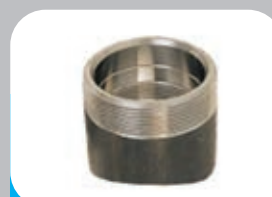
KIT RACCORDO ACCIAIO A SALDARE DN 2" 1/2 X DUO BAG