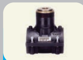
SELLA X TUBI PE X DUO BAG 12 DN 90