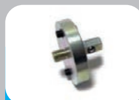
MANDRINO PORTATAPPI X MAXI 6-12 FINO 2"- 6"